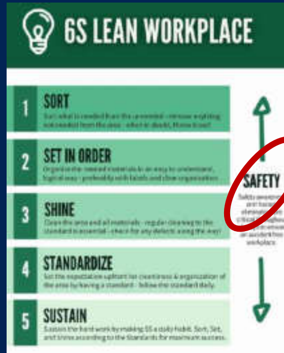
6S: Safety always