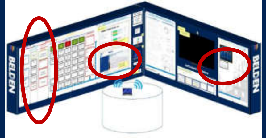
LDM corner: Safety first and everywhere