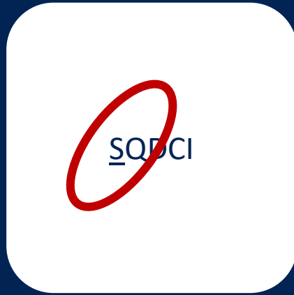
LDM: Safety first