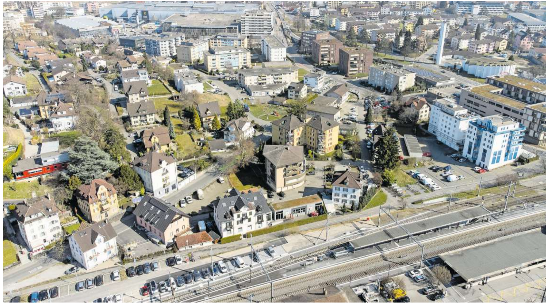
Oben: Das Gebiet Schützenmatt beim Bahnhof Emmenbrücke. Unten: Ideenskizze für eine mögliche Neubebauung der Schützenmatt.

Das Gebiet Schützenmatt soll neu geplant werden. Die Investorin will ein Debakel wie beim Areal Sonne vermeiden.