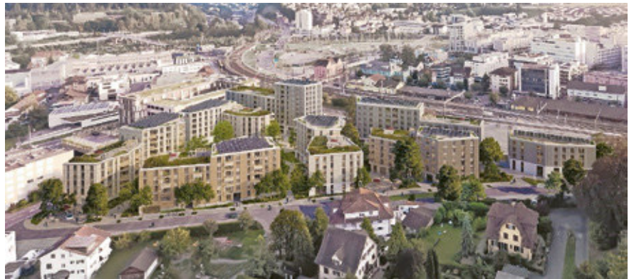
Auf dem Areal Schützenmatt soll ein lebenswertes Quartier mit viel Grünräumen entstehen.

Vom 15. April bis 14. Mai 2024 findet die öffentliche Mitwirkung zum Bebauungsplan Schützenmatt statt. Nach den zwei erfolgten Mitwirkungen zur Entwicklungsstudie und zum Richtprojekt wird mit dem Start der öffentlichen Mitwirkung zum Bebauungsplan ein weiterer Meilenstein in der Entwicklung «Zukunft Schützenmatt» erreicht.