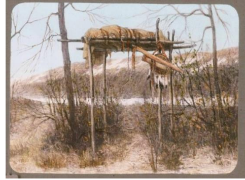
Afb 6 rechts: excarnatieplatform

Zou het dus kunnen zijn dat hier eenzelfde ritueel werd uitgevoerd als bij Stonehenge? Dus de doden werden per boot over het stroompje naar de Middelweg vervoerd en van daaruit naar plek aan de Koningin Wilhelminalaan gebracht. De waterputten zouden gebruikt kunnen zijn voor het wassen van de lijken, voordat deze naar de dodenhuisjes/-platformen werden gebracht om te excarneren. De botresten werden dan via het pad met aan één zijde een greppel (dus: "Larsheim Avenue"), in de grafheuvels bij de Tombe van Nellesteijn bijgezet.