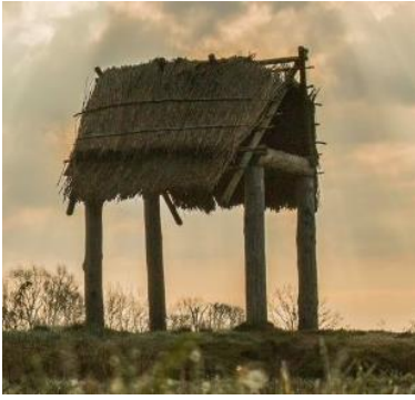
Afb 5 links: dodenhuisje of excarnatiehuisje