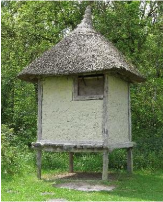
afb. 2 Spieker.

Inmiddels is er een theorie ontwikkeld waar deze plek voor gediend zou kunnen hebben en om die te begrijpen, zijn recente ontwikkelingen van stonehenge in Engeland van belang.