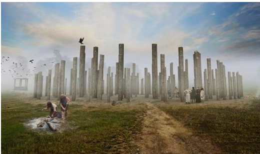
Afb 3 links: woodhenge

Stonehenge is een grafheuvel, omringd met grote stenen. Maar in het gebied rondom stonehenge is veel meer te zien. Zo is er ook woodhenge: een plek omringd door houten palen (zie afb. 3). En er waren restanten die wijzen op tijdelijke bewoning vlakbij een rivier en verderop in de rivier was een plek, die bluestonehenge wordt genoemd. Bij stonehenge (zie afb. 4) werden twee greppels gevonden, evenwijdig aan elkaar. De grond uit de greppels werd gebruikt om een weg te maken tussen de greppels, die ook wel Stonehenge Avenue wordt genoemd, een soort verhoogde toegangsweg tot stonehenge. De theorie over het gebied bij stonehenge is dat mensen hun overledenen naar woodhenge (hout is levend materiaal) brachten en daar in de buurt tijdelijk verbleven. De overledenen werden dan met bootjes over de rivier naar bluestonehenge gebracht en vandaar over land in een processie richting stonehenge (steen is dood materiaal). De doden werden dan in processie over de 'Stonehenge Avenue' naar de grafheuvel gebracht en daar begraven (de overgangsrite).