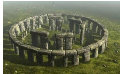
Afb 4 rechts: stonehenge

Deze theorie zou ook op Leersum toegepast kunnen worden. De greppel die gevonden is aan de Koningin Wilhelminalaan loopt in noordelijke richting en in het verlengde van deze greppel liggen de grafheuvels (bij de Tombe van Nellesteijn). Ook is op paleogeografische kaarten te zien dat er een stroompje was van de plek waar nu Amerongen is naar, wat nu, Leersum is. Uit eerder onderzoek zijn aanwijzingen gevonden dat op de Middelweg (tijdelijke) bewoning is geweest (zie afb 7) tijdens de IJzertijd. Maar wat doen die spiekers dan op het stukje grond aan de Kon. Wilhelminalaan? Er zijn daar immers geen vondsten gedaan die op bewoning wijzen en dus was een spieker als proviandkast niet nodig. Het kan heel goed zijn dat het geen spiekers waren, maar dat de gevonden palen behoorden bij zgn dodenhuisjes of dodenplatforms (zie afb. 5 en 6) en dat daar de lijken werden gelegd voor excarnatie (= 'ontvlezing', dus het verwijderen van vlees en organen), waarna de botten in processie naar de grafheuvels werden gebracht. Dat verklaart de veelheid aan paalrestanten.